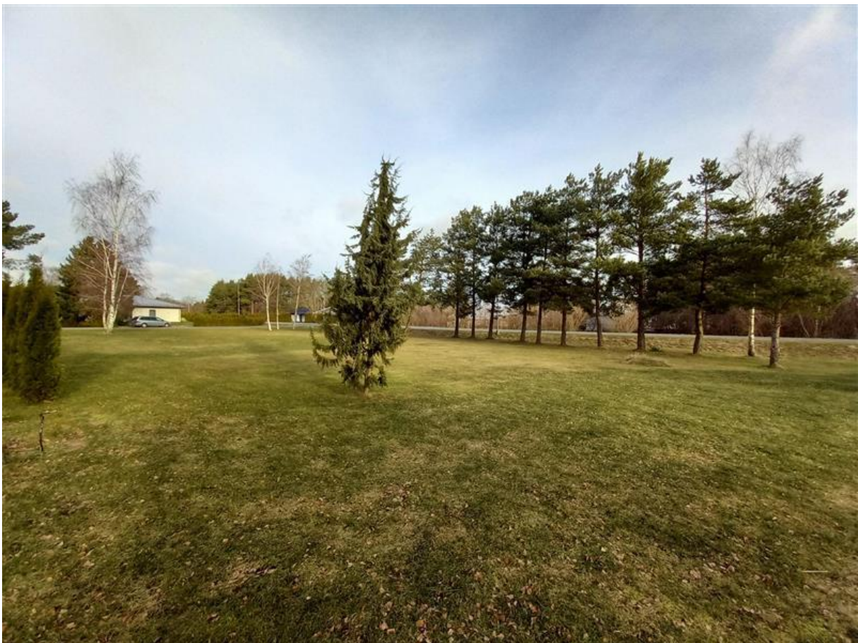
Joonis 2. Planeeritava ridaelamu asukoht idast vaadatuna.

Detailplaneeringuala asub Saaremaa vallas, Orissaare alevikus Kuuse tn 1 katastriüksusel. Alal on kehtiv Kuivastu mnt 44 detailplaneering (kehtestatud 28.11.2019. a. Saaremaa Vallavolikogu otsusega nr 1-3/110), mille eesmärgiks on elamute ning kontori/laohoone planeerimine, ehitusõiguse määramine, liiklusskeemi ja parkimise lahendamine, haljastuse lahendamine, tehnovõrkude ja –rajatiste planeerimine, servituutide ja kitsenduste vajaduse määramine. Kehtivat Kuivastu mnt 44 detailplaneeringut on hakatud ellu viima: toimunud on kruntideks jagamine vastavalt planeeringule, sihtotstarvete muutmine (neli elamumaad, üks transpordimaa, üks ärimaa), rajatud on kruntide vaheline juurdepääsutee (munitsipaalomandis), ühele krundil on valminud elamu ja kahele krundile on väljastatud ehitusload elamu ehitamiseks. Ehitisregistri (edaspidi EHR ) kohaselt on planeeritaval Kuuse tn 1 katastriüksusel kontorihoone (EHR kood 121316710) ja rajatisena kinnistu vee- ja reovee torustik (EHR kood 221338412). Lisaks on algatamise taotluse kohaselt katastriüksusele rajatud madalpingekaablid, juurdepääsutee ja parkimisala. Juurdepääs planeeringualale on avalikult kasutatavalt Tumala - Orissaare - Väikese väina tee tugimaanteelt (tee nr 75), edasi munitsipaalomandis Kuuse tänav (katastritunnus 71401:001:1484) transpordimaalt. Planeeringuala kõlvikuline koosseis on 2849 m 2 muu maa ja 1422 m 2 õuemaad.