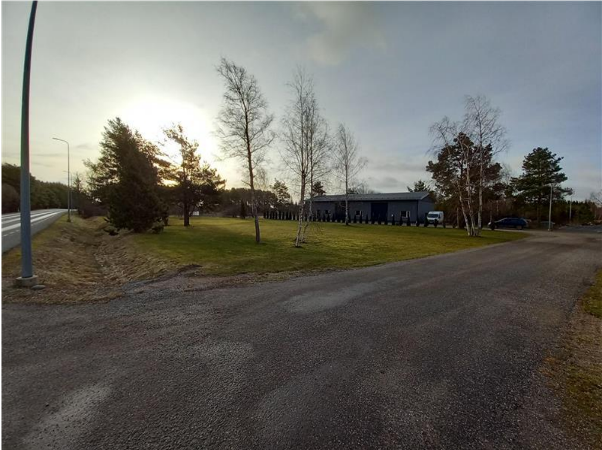
Joonis 4. Planeeringuala vaadatuna läänest mahasõiduteelt.