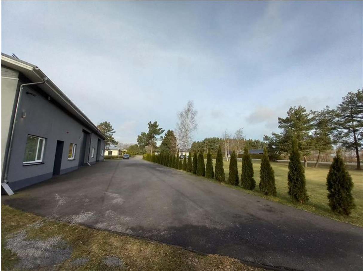
Joonis 3. Planeeringuhoonele rajatud kontorihoone vasakul ja planeeritava ridaelamu asukoht paremal.

Planeeringuala paikneb keskmiselt kaitstud põhjaveega alal. Reostatud pinnase kohta andmed puuduvad. Saare maakonnaplaneering 2030+ ruumiliste väärtuste kaardi järgi asub planeeringuala väärtuslikul maastikul. Planeeringu elluviimisel lähtutakse juba olemasolevast asustusmustrist ja struktuurist, kasutades juba olemasolevaid teid ja infrastruktuuri. Planeeringualal ei ole pärandkooslusi ning tegemist pole põllu-, heina- ja karjamaaga. Vastuolu väärtuslike maastike tingimustega ei ole.